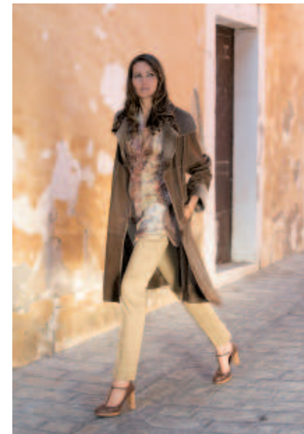
Eppendorfer Landstr. 54 · 20249 Hamburg · Ruf & Fax 040.476590 info@pelzwerkhamburg.de · www.pelzwerkhamburg.de